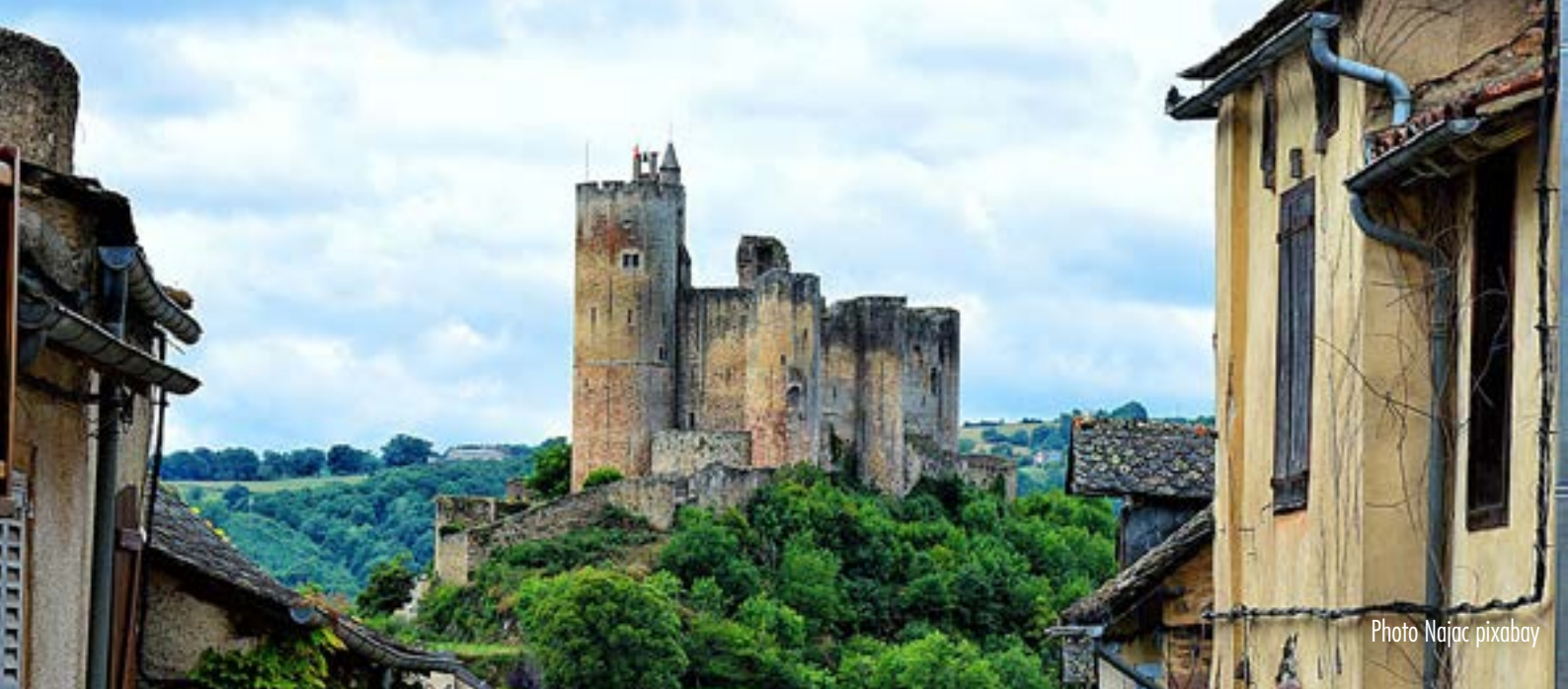
Photo Najac